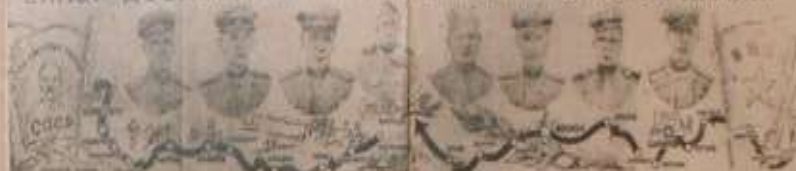
Ильяши Советской артиллерии