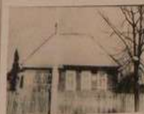
Дом, в котором родился В.С. Курков.