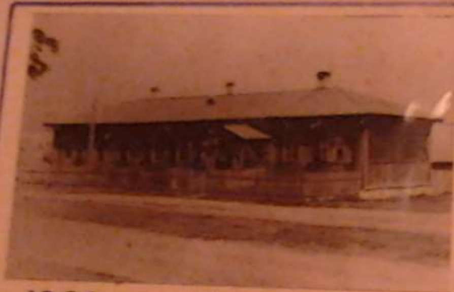
1896 г. - в п. Бытошь было открыто начальное училище.

В конце XIX века в поселке построили начальное училище. В 1936 года – здание современной школы.