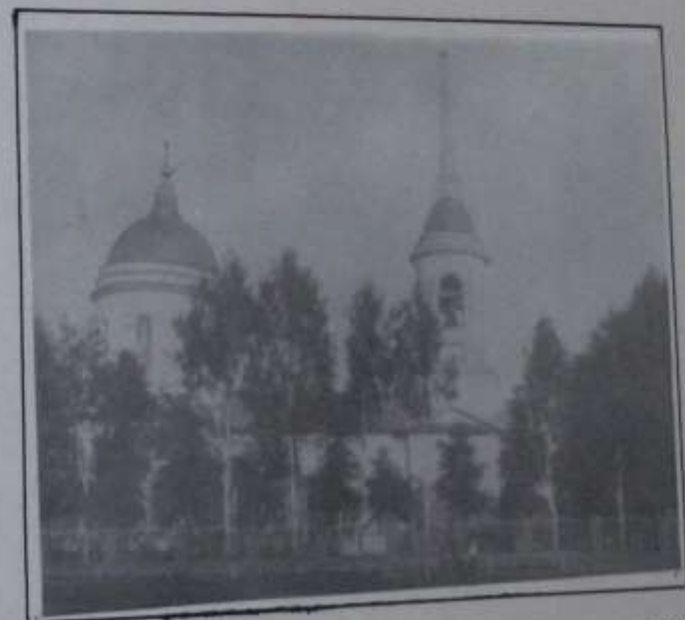
Здание церкви. Начало XX века. фотокопия. 281.