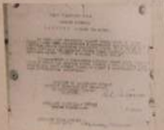
Поздравление Куркову В.С. от командования.