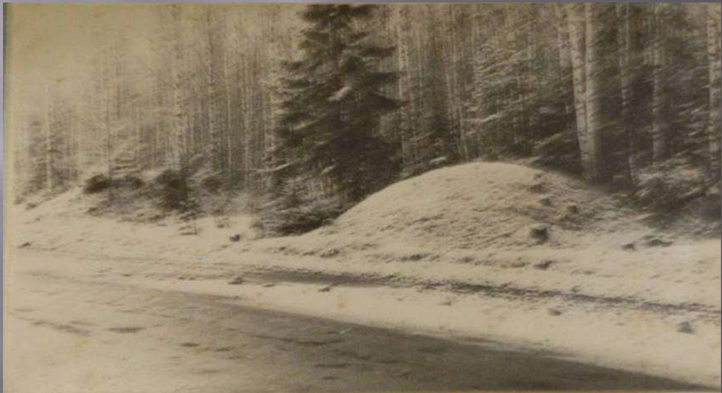
Курганы в р-не п. Петровский

Именно он первым занялся изучением курганов древних вятичей, расположенных недалеко от п. Петровский.