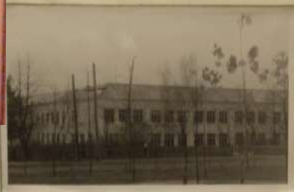
Бытошская средняя школа