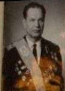
ПЕТР МАТВЕЕВИЧ МАРЮТИН КОМАНДИР ВОЗДУШНОГО КОСМОДИНА