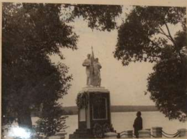
Памятник женщинам-аршизмам за борьбу Бытовского озера.

В.Александров, В.Дуванников. Гравёр "Мамы в саду" 1960г.