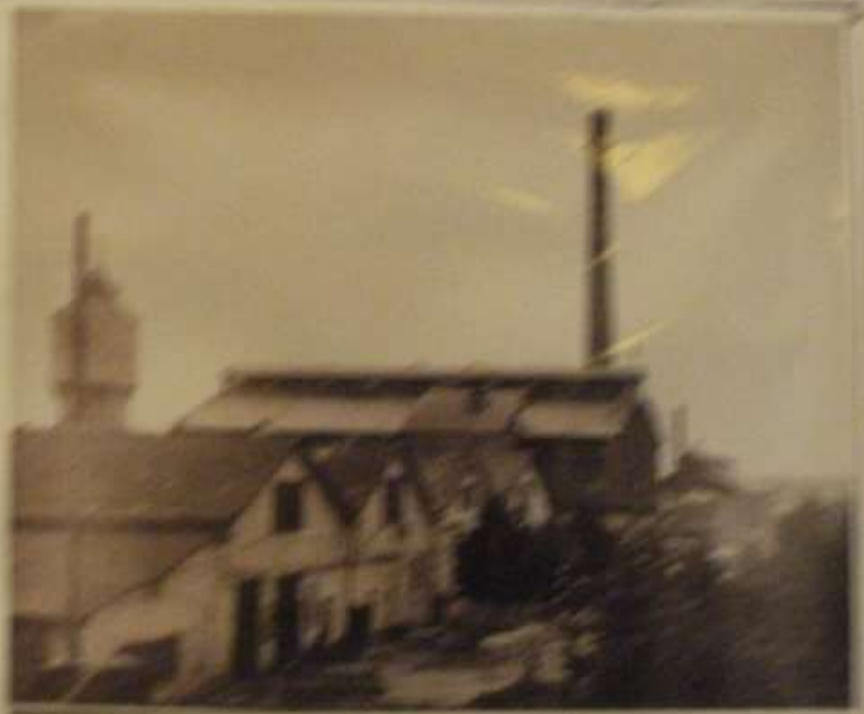
Бытошевский стекольный завод. 60 е годы.

В 1911 году был построен БСЗ. С начала 90х годов ОАО «Кварцит»